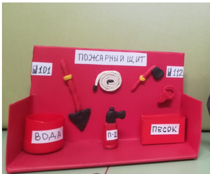
Лузин Денис (6 лет).