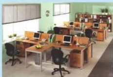
Столы на П-образных опорах

Основные достоинства металлокаркаса с опорами П-образной формы — высокая жесткость и универсальность конструкции. На сегодняшний день они являются самыми прочными и надежными!